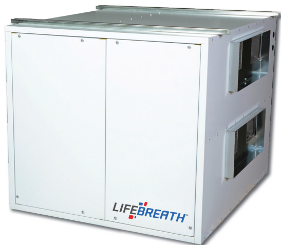
730 ERV - ECM