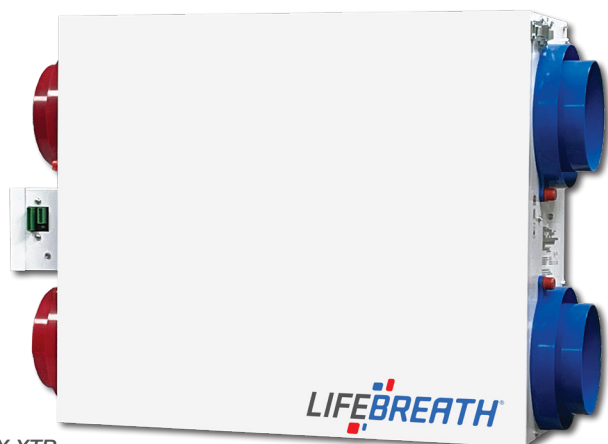
MAX XTR 184 PCM @ 0.3 (75) IN. W.G. (PA)